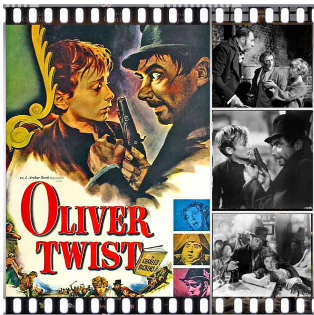
Prescripción 1. Oliver Twist (David Lean, 1948).

Una obra así ha tenido diversas versiones cinematográficas en diferentes épocas y con distintos niños protagonistas: