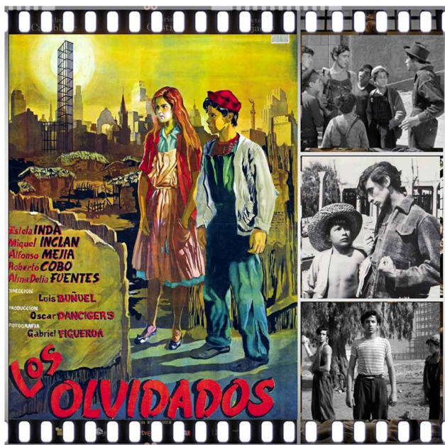
Prescripción 2. Los olvidados (Luis Buñuel, 1950).