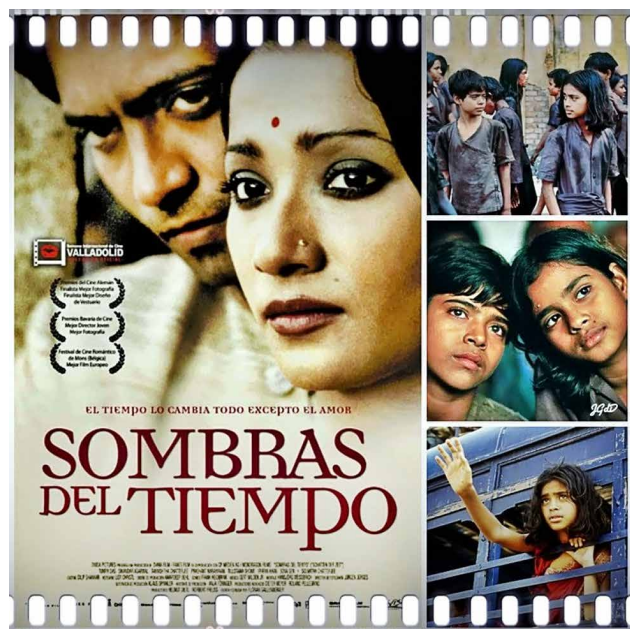
Prescripción 4. Sombras del tiempo (Florian Gallenberger, 2004).