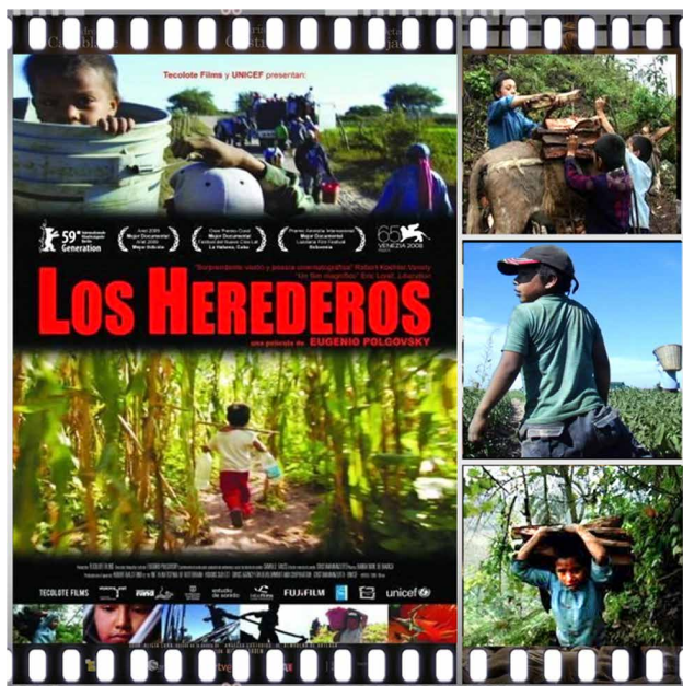
Prescripción 6. Los herederos (Eugenio Polgovsky, 2008).