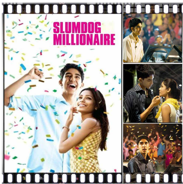
Prescripción 7. Slumdog Millionaire (Danny Boyle, 2008).