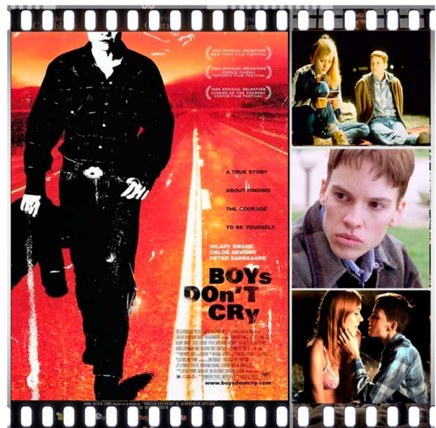
Prescripción 1. Boys Don't Cry (Kimberly Peirce, 1999).