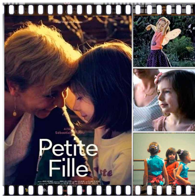
Prescripción 5. Una niña (Sébastien Lifshitz, 2020).

En cada escena de Una niña , esa preciosidad de niña llamada Sasha llena la pantalla de buenos sentimientos pese a tanto sufrimiento. Una lección de resiliencia a tan temprana edad, a veces superior a la de sus padres, que caen con frecuencia ante el dolor de ver que a su hija se le está pasando