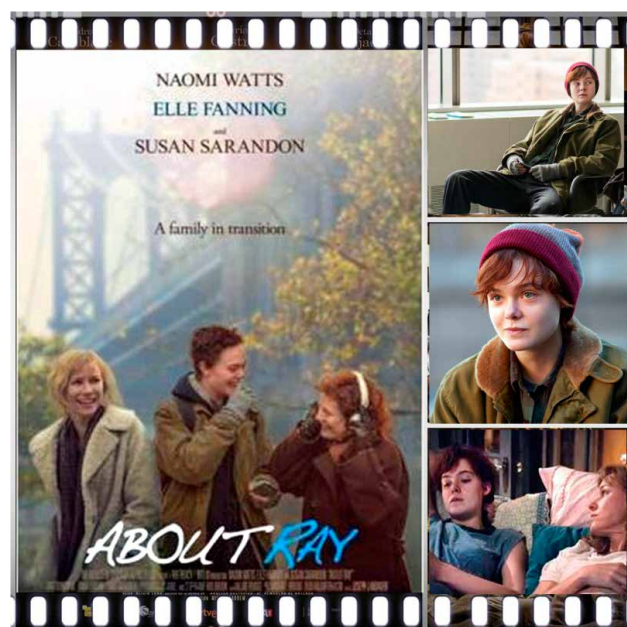
Prescripción 2. 3 generaciones (Gaby Dellal, 2015).

3 generaciones es un canto al amor, a la familia, a la aceptación y a la comprensión, que intenta revisar la diversidad del arco iris a través de las diferentes generaciones del título. Porque el deseo de nuestro protagonista de alcanzar la