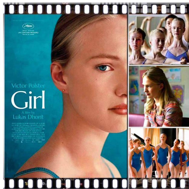
Prescripción 3. Girl (Lukas Dhont, 2018).

Nora Monsecour tenía un sueño: quería ser bailarina. Un sueño que apareció desde que dio sus primeras lecciones de