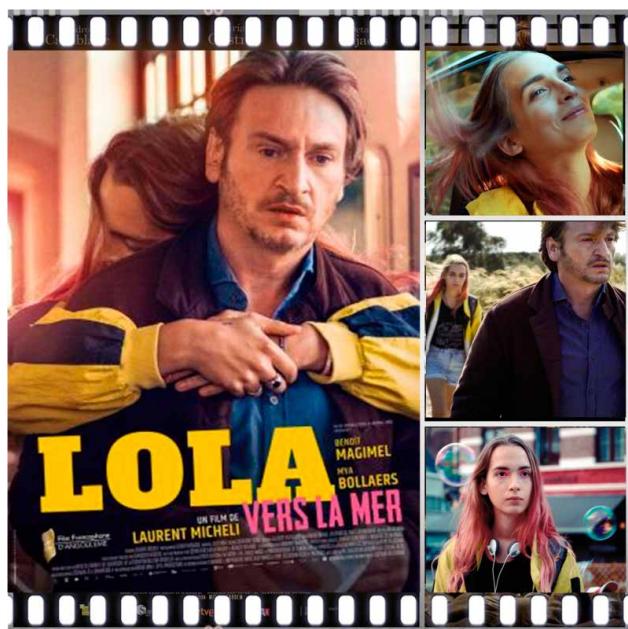
Prescripción 4. Lola (Laurent Micheli, 2019).