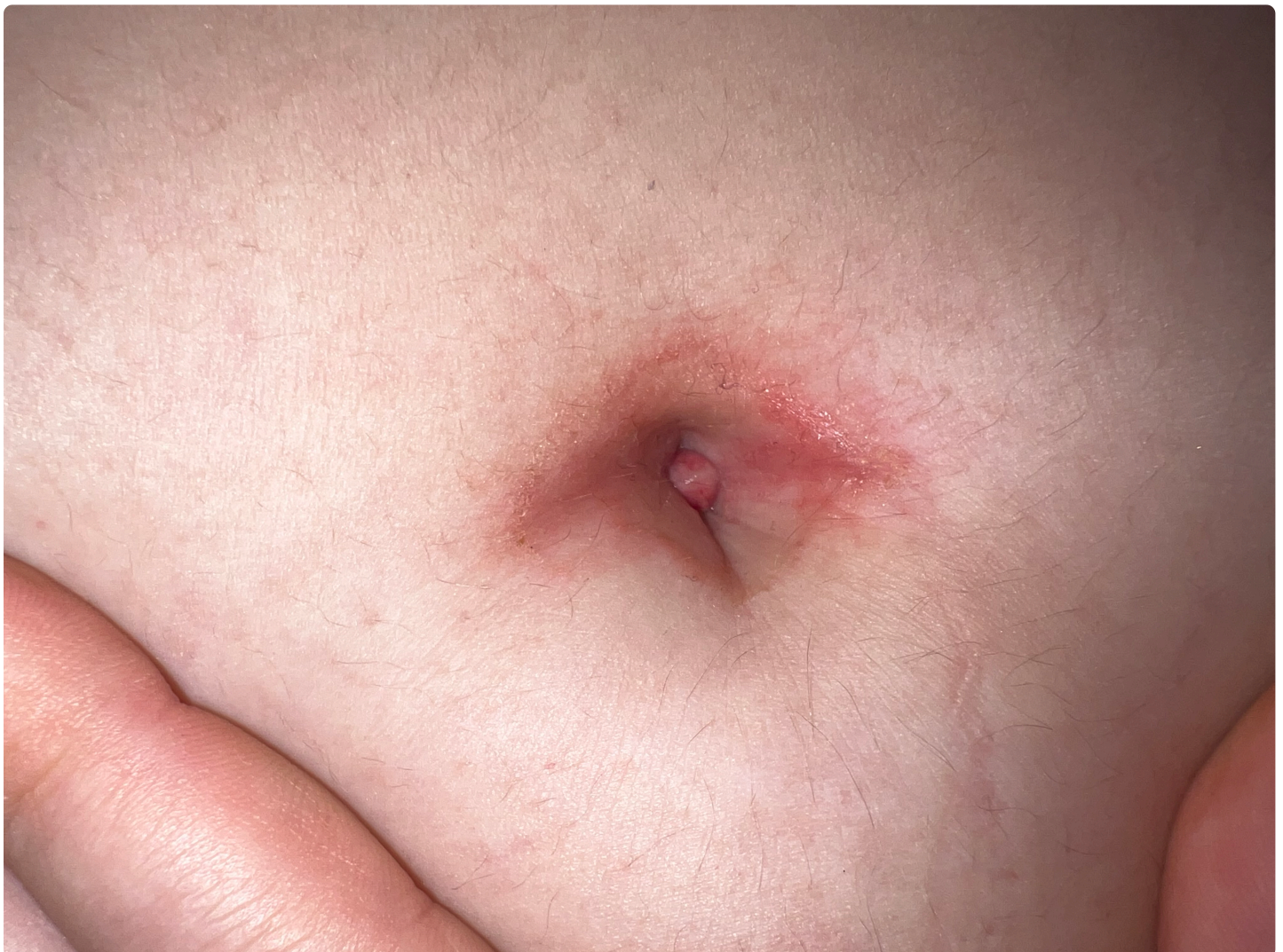
Fig. 1. Lesión pediculada de 0,5 cm de longitud, exudativa, blanda a la palpación, pero dolorosa y friable.