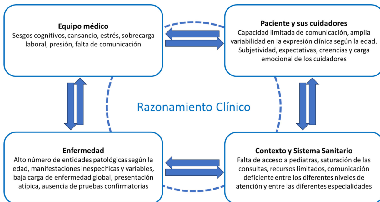
Figura 2 Esquema relacional de los factores que contribuyen a los problemas de seguridad diagnóstica. Fuente. Adaptado de Merkebu J et al. 12 .