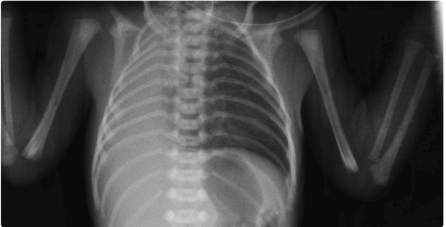
Fig. 1. Radiografía torácica: opacificación completa del hemitórax derecho, con desplazamiento de las estructuras mediastínicas hacia el lado ipsilateral.

Recién nacido de 33 semanas y 1500 g de peso que ingresa por prematuridad y distrés respiratorio. Embarazo controlado irregularmente. Apgar 6/8. En la exploración al nacimiento se detecta tiraje sub- e intercostal leve, hipoventilación en hemitórax derecho, tonos cardiacos desplazados ipsilateralmente y abdomen excavado. Precisa ventilación no invasiva con presión positiva continua de la vía aérea (CPAP) durante las primeras horas de vida, quedando posteriormente en respiración espontánea. Se realiza una radiografía de tórax ( Figura 1 ).