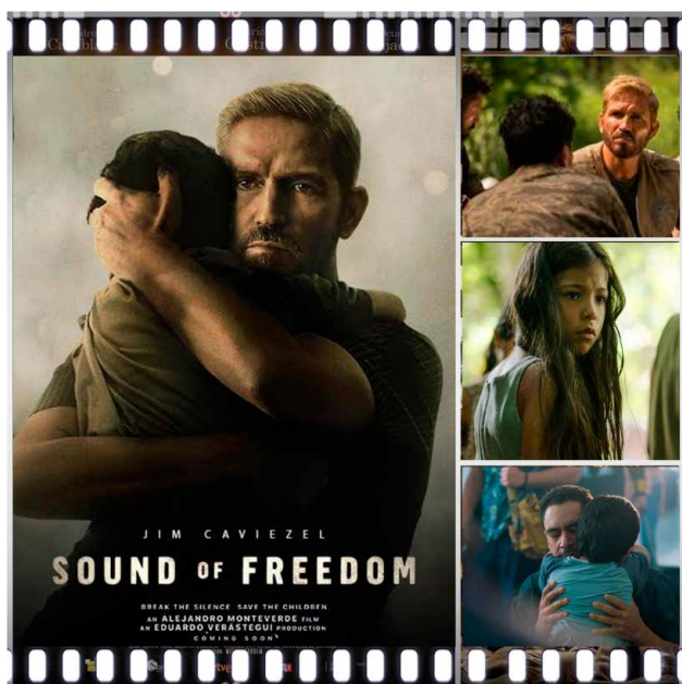
Prescripción 7. Sonido de libertad (Alejandro Monteverde, 2023).

El conocimiento que se tiene sobre el abuso sexual infantil es insuficiente y se asienta en ocasiones en una evidencia empírica parcial y anecdótica. Pero si se desea erradicar de nuestra sociedad, los poderes públicos deben poner los medios para profundizar en la investigación del problema y divulgar de una forma más amplia el conocimiento que se tiene sobre el mismo. Y ello porque el impacto de los abusos sexuales a menores de edad en el corto plazo es muy significativo y muchas secuelas se manifiestan en la edad adulta, teniendo consecuencias en la salud mental del afectado. El coste en el presente y en el largo plazo para las víctimas y la sociedad en su conjunto es enorme, de ahí la necesidad de hacer hincapié en la prevención de los abusos sexuales, en su detección temprana y en la atención a las víctimas. Destacamos en este sentido el Estudio de Fundación ANAR, “Abuso sexual en la infancia