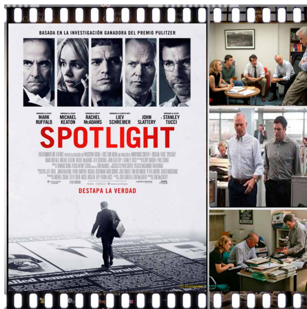
Prescripción 5. Spotlight (Tom McCarthy, 2015).

Spotlight comienza con una escena inicial y el epígrafe “Basado en hechos reales. Boston, 1976” . Y en la siguiente escena todo el ajeteo de las oficinas del Boston Globe ya en el año 2001. Y allí descubrimos a los cuatro reporteros de “Spotlight” , la sección de periodismo de investigación de ese perio-