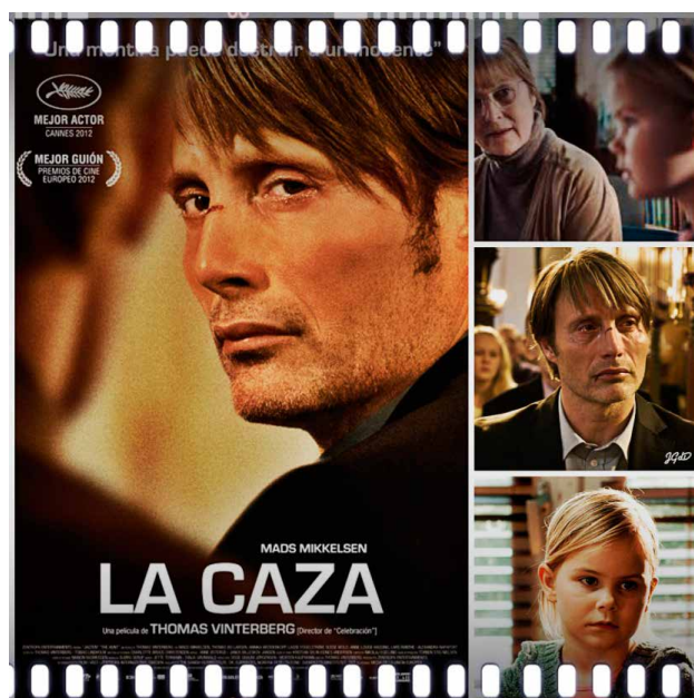
Prescripción 4. La caza (Thomas Vinterberg, 2012).

Porque aquí se desarrolla un detallado análisis de lo que podíamos llamar el fascismo social, esta tendencia de todas