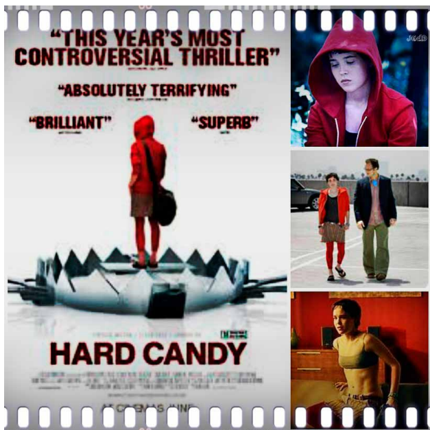
Prescripción 2. Hard Candy (David Slade, 2005).

concierto de un grupo. Cuando Jeff despierta se da cuenta de que está atado a una silla... A partir de ahí comienza el “tour de force” interpretativo entre los dos actores con una puesta en escena casi teatral, donde la actuación de Ellen Page y el guión de Brian Nelson son lo más destacable de esta película que no deja indiferente.