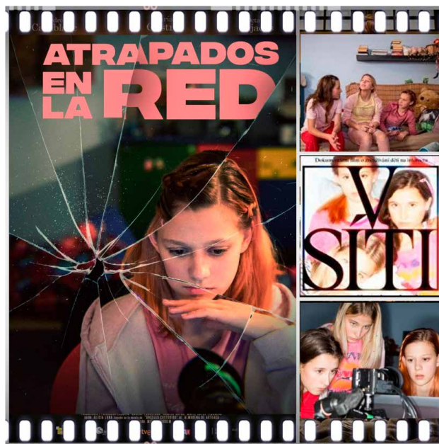
Prescripción 6. Atrapados en la red (Barbora Chalupová, Vit Klusák, 2020).

Atrapados en la red es un experimento cinematográfico en formato documental que descubre una dura realidad para provocarnos y tomar partida, y donde la realidad siempre supera la ficción. Pues comienza informando al espectador con estos mensajes de atroz estadística: “El 60 % de los niños checos pasan tiempo en Internet sin control parental. El 41 % confirma haber recibido imágenes pornográficas de otra persona. Uno de cada dos niños chatea con desconocidos. Una quinta parte no rechazaría conocerse en persona”. Luego se nos informa de varios aspectos en la realización de la película. El anuncio del casting: “Los realizadores de un documental buscan una actriz adulta con aspecto de niña entre 12 y 13 años. Por favor, acude al casting con ropa de niña”... Y el resultado: “Veintitrés chicas se presentaron al casting. Diecinueve habían sufrido algún tipo de abusos en Internet de niñas”. Y el método de actuación: “Tres actrices. Tres habitaciones infantiles. Diez días en Internet de 12 a 24 horas”. Y con este código de conducta: “1. No nos acercamos a nadie, solo respondemos. 2. Al principio, las actrices deben enfatizar que tienen 12 años. 3. No flirteamos, no seducimos, no provocamos. 4. Ante órdenes sexuales,