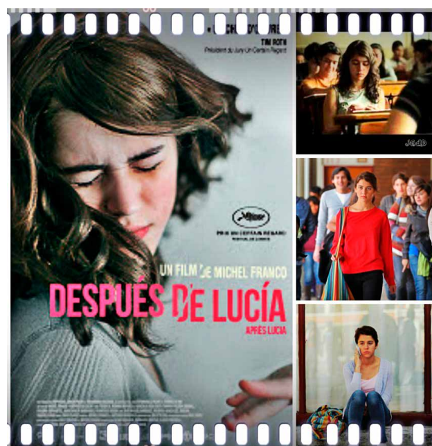
Prescripción 3. Después de Lucía (Michel Franco, 2012).

El trailer de presentación de esta película no deja duda: después de la diversión, después de las bromas, después de las burlas, después de la humillación, después de la violencia, después del dolor... Basada en miles de historias reales..., tal vez la tuya o la de un hijo o hija tuyo.