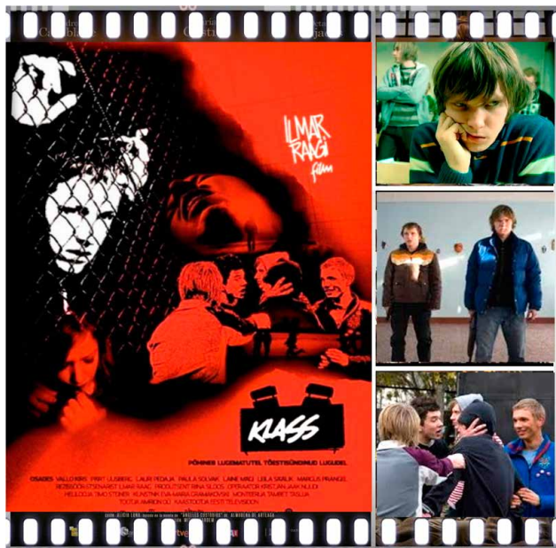
Prescripción 1. Klass (Ilmar Raar, 2007).