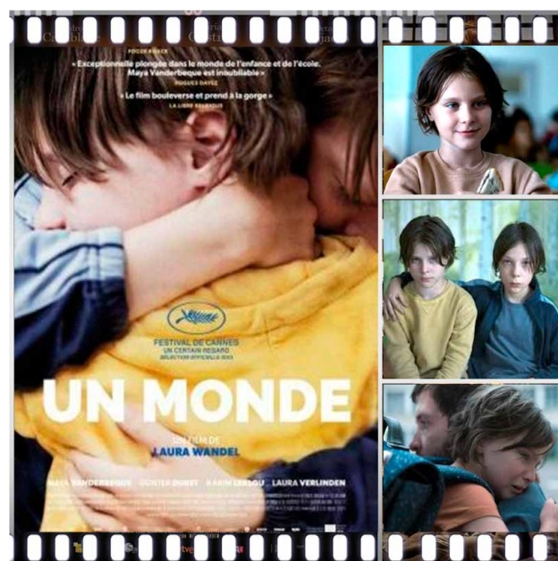
Prescripción 7. Un pequeño mundo (Laura Wandel, 2021).