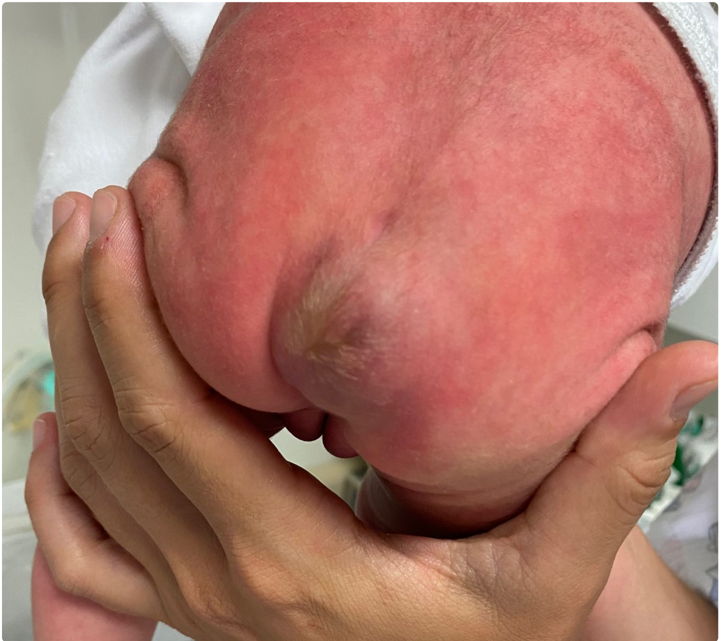
Fig. 1. Masa localizada en sacro, móvil, blanda, de unos 2 x 3 cm aproximados. Piel violácea supradistante. Vello lesional. No se objetivan fistulas. No secreciones a nivel de la masa.