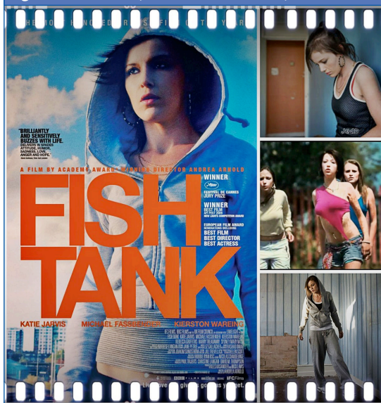
Figura 7. Fish Tank (Andrea Arnold, 2009)