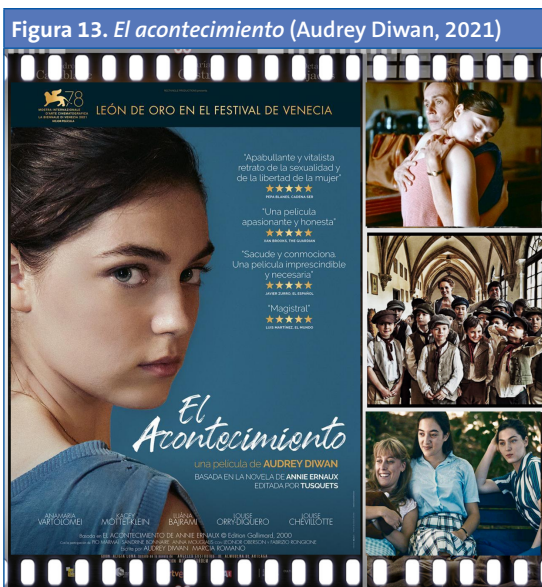
Figura 13. El acontecimiento (Audrey Diwan, 2021)