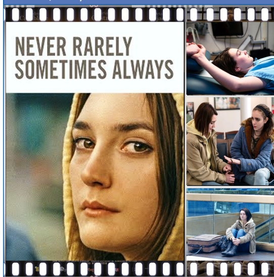
Figura 12. Nunca, casi nunca, a veces, siempre (Eliza Hittman, 2020)

muy personales. Y todo lo que tienes que responder es nunca, casi nunca, a veces, siempre. Es algo así como unas preguntas de selección múltiple, pero no es un examen”.