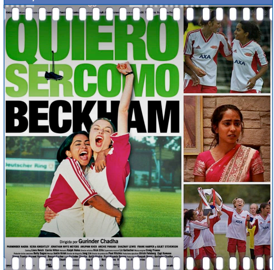
Figura 2. Quiero ser como Beckham (Gurinder Chadka, 2002)