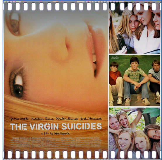
Figura 1. Las vírgenes suicidas (Sofía Coppola, 1995)

que realmente nos perseguimos a nosotros mismos”.