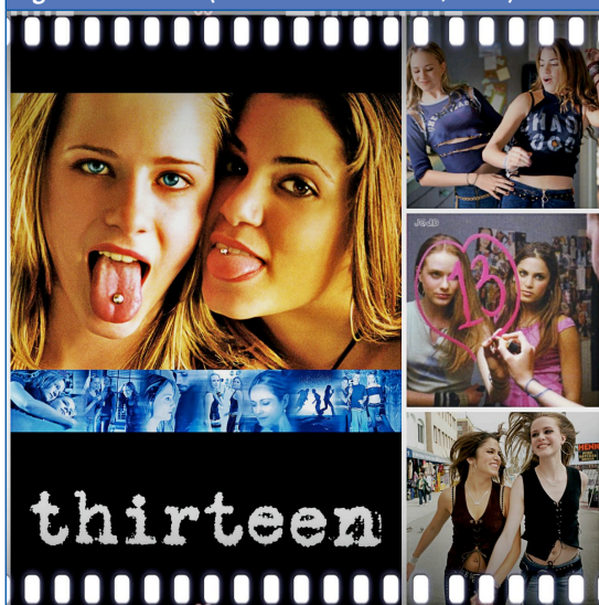
Figura 3. Thirteen (Catherine Hardwicke, 2003)