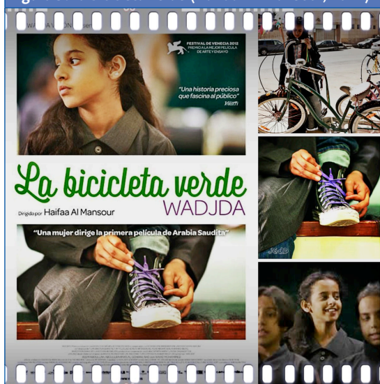
Figura 9. La bicicleta verde (Haifaa Al-Mansour, 2012)