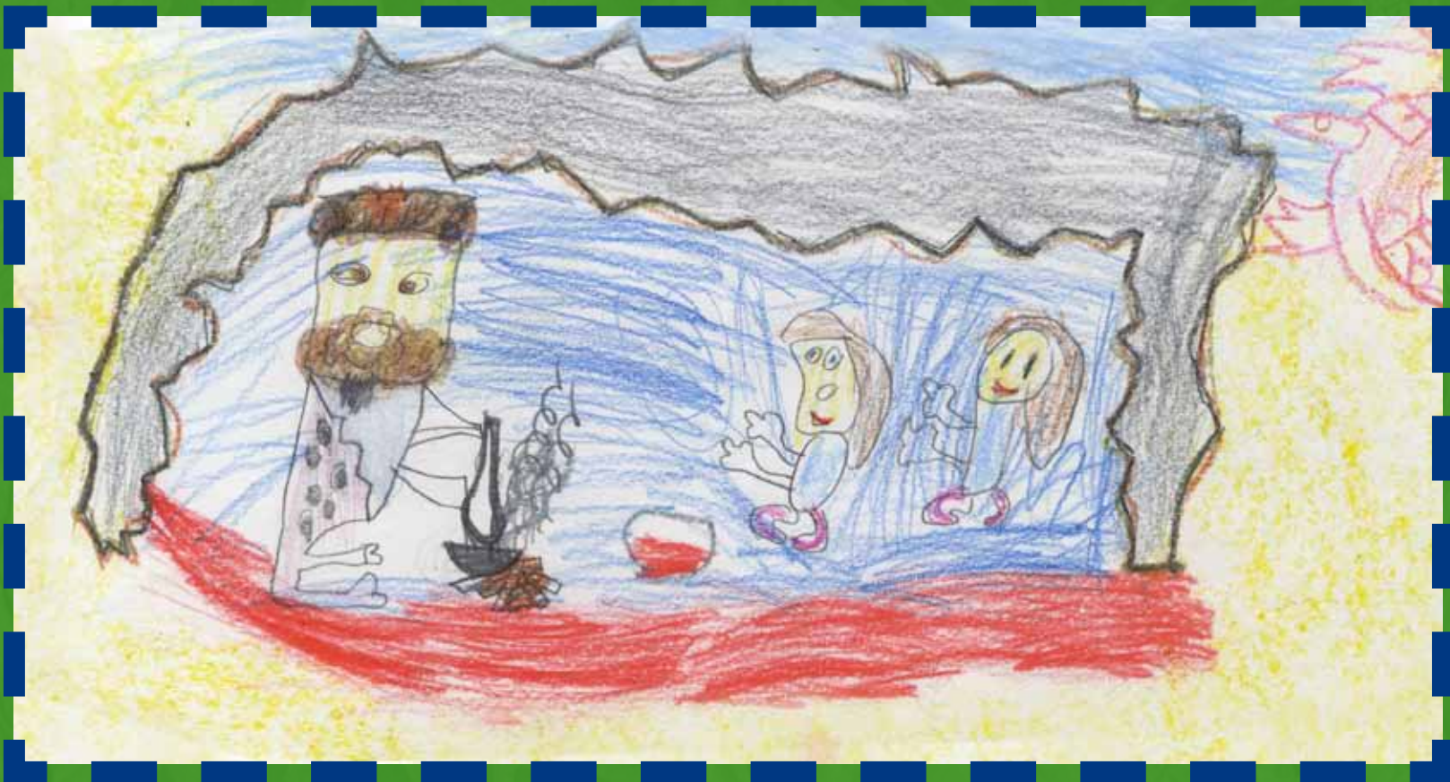
Victor 7 años