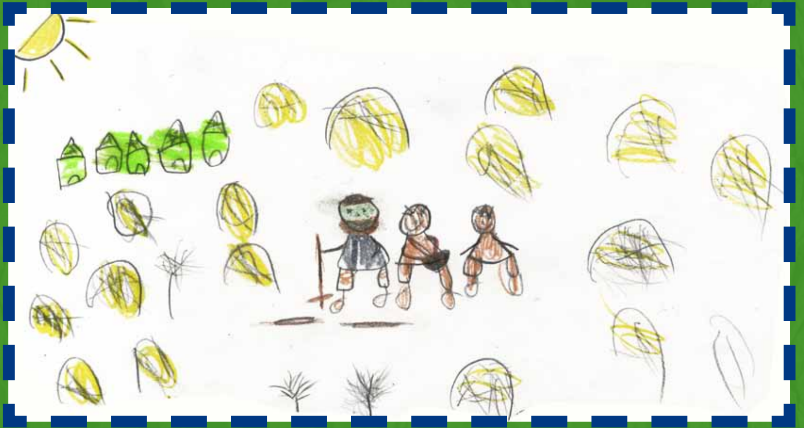
Nayara 6 años