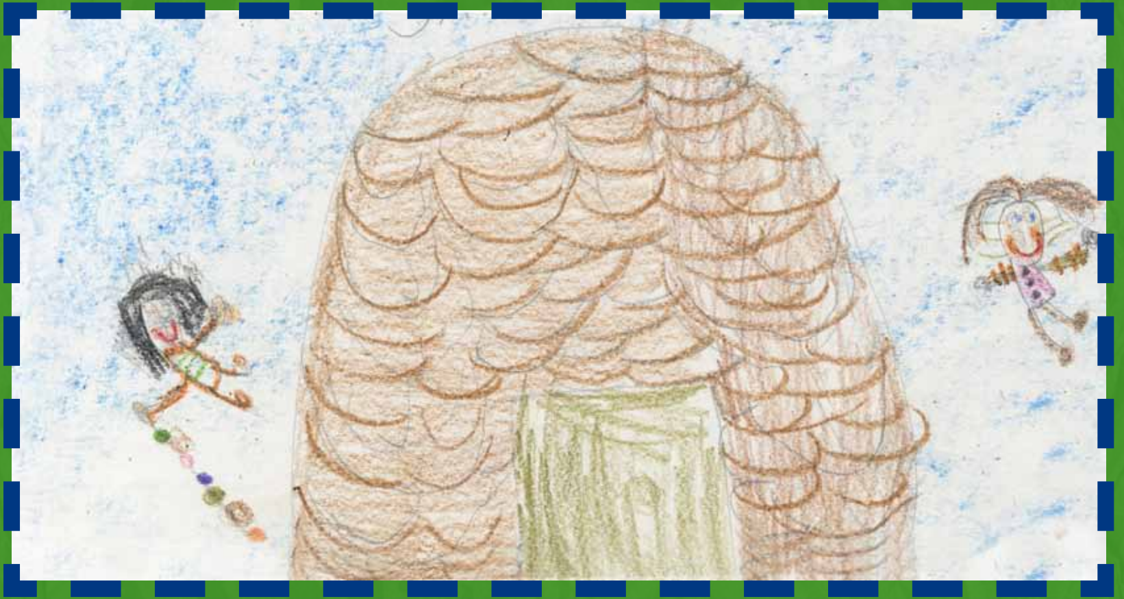
Sara 4 años