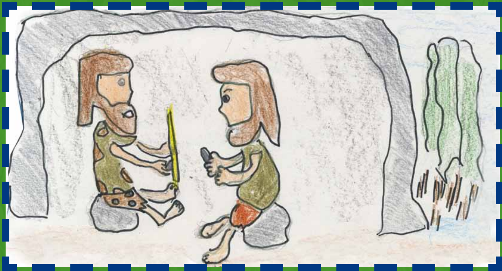
Erick 9 años