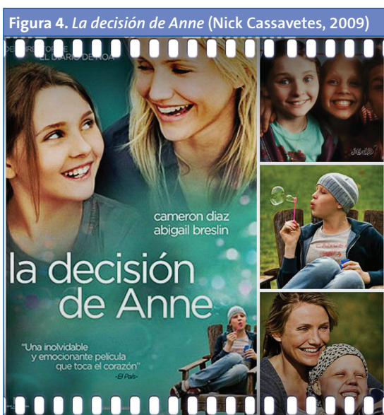
Figura 4. La decisión de Anne (Nick Cassavetes, 2009)