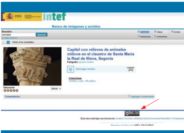
Figura 3. Resultado de una búsqueda de imágenes en el Banco de imágenes y sonido del INTEF