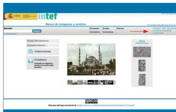
Figura 2. Banco de imágenes y sonidos del Instituto Nacional de Tecnologías Educativas y de Formación del Profesorado (INTEF) del Ministerio de Educación, Cultura y Deporte

genes/web/) para ser utilizadas con fines únicamente educativos. En este banco se puede acceder a las imágenes que se muestran tanto en la parte derecha superior como en la parte izquierda de la zona central. Las imágenes están clasificadas en tres epígrafes (Primaria-ESO-Bachillerato/Formación profesional/Colecciones). También tiene un buscador que permite introducir texto para encontrar una imagen, pudiendo restringir la búsqueda a fotografías, ilustraciones, vídeos, animaciones y sonido (figura 2).