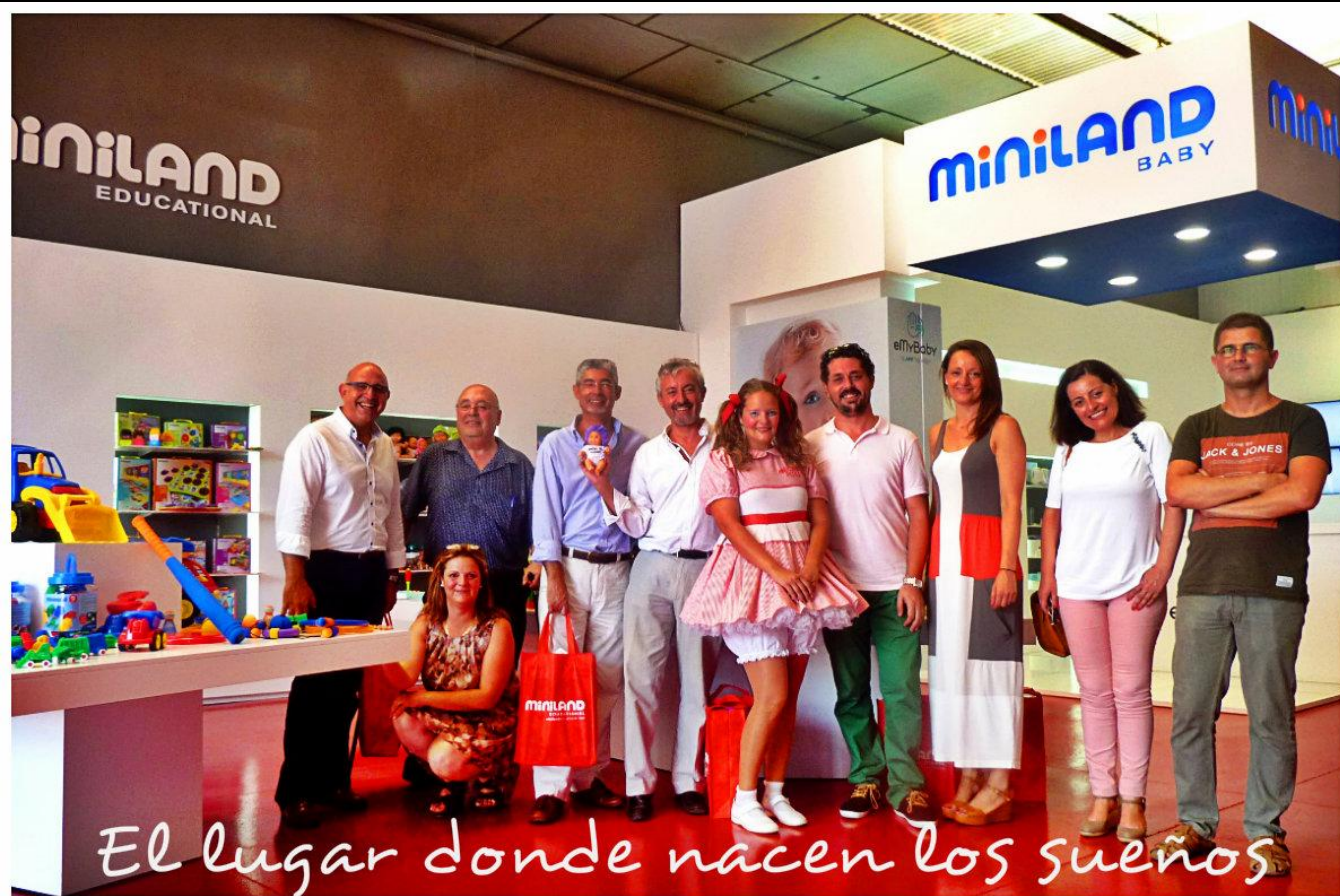
El lugar donde nacen los sueños