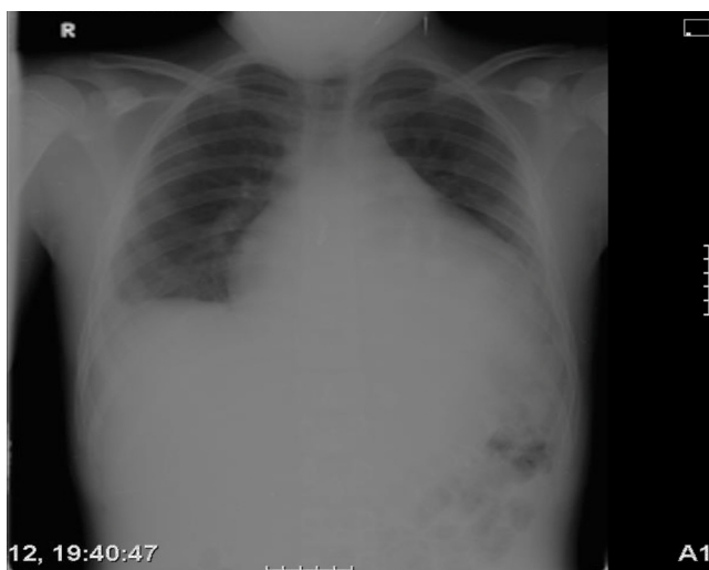
Figura 2 Rx de tórax con empeoramiento clínico.