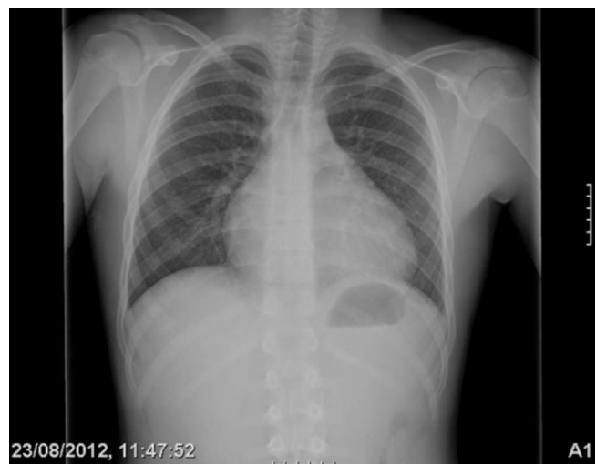
Figura 1 Rx de tórax de ingreso.

Se ingresa con tratamiento con antibióticos e indometacina por vía intravenosa. A las 30 h de ingreso, se produce un empeoramiento clínico con polipnea, tos frecuente y aumento del trabajo respiratorio. La radiografía de tórax de control (fig. 2) presentaba cardiomegalia y derrame pleural bilateral. En la ecocardiografía (fig. 4) muestra un aumento de derrame pericárdico (26 mm) en AD, con signos de colapso de AD y ventrículo derecho en diástole, aumento de tamaño de la vena cava inferior. En la ecografía abdominal se observan signos de congestión hepática.