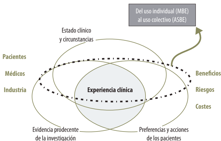
Fig. 1-2. Modelo actualizado en la toma de decisiones basado en pruebas.

siones intenta mejorar los anteriores, especialmente respecto a la experiencia clínica y el énfasis que debe ponerse en la preferencia y en las acciones de los pacientes y estimular la discusión para la evolución de la Asistencia sanitaria basada en la evidencia. 13