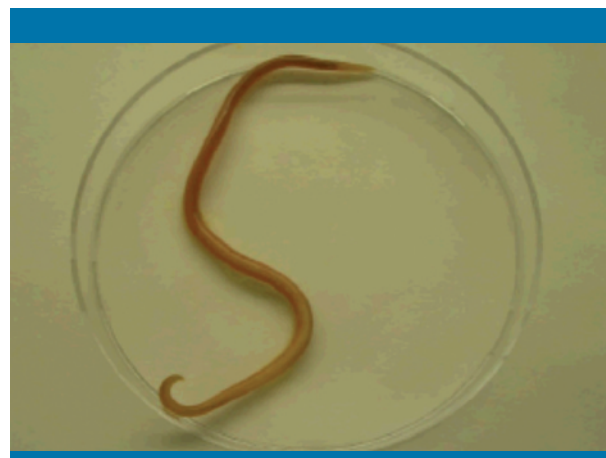
Figura 2. Ascaris lumbricoides eliminado por la paciente

Ante estos datos se estableció el diagnóstico de peritonitis secundaria a una perforación intestinal debida a la parasitación por A. lumbricoides . La paciente recibió albendazol (400 mg) en dosis única en dos ciclos separados 20 días, y meropenem i.v. durante 24 días.